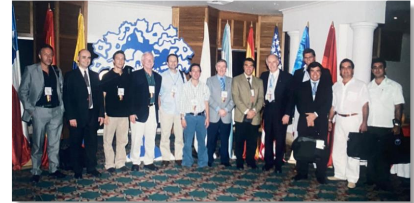
Curso internacional de patología de hombro en Cartagena - 2006