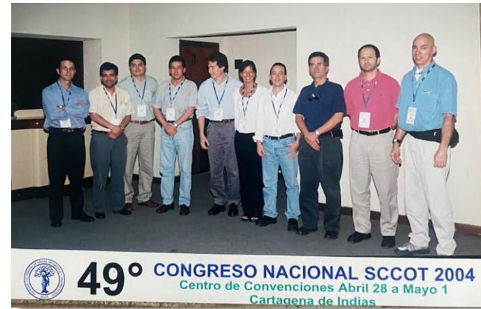
49º CONGRESO NACIONAL SCCOT 2004 Centro de Convenciones Abril 28 a Mayo 1 Cartagena de Indias