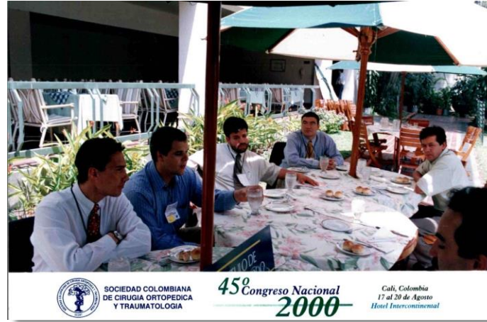
SOCIEDAD COLOMBIANA DE CIRUGIA ORTOPEDICA Y TRAUMATOLOGIA 45º Congreso Nacional Cali, Colombia 17 al 20 de Agosto Hotel Intercontinental