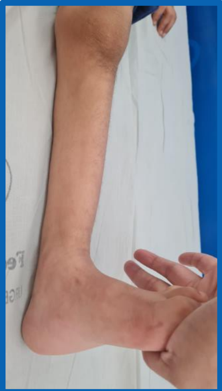
Negativo para recidiva