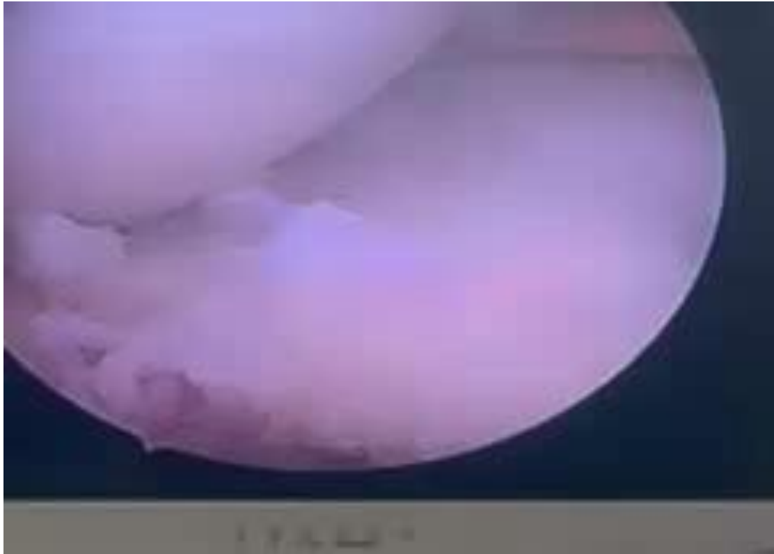
VIDEO: MANEJO DE LA FRACTURA CON SUTURA COMO MECANISMO DE FIJACIÓN