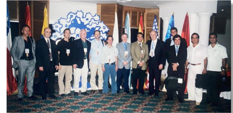
Curso internacional de patología de hombro en Cartagena - 2006