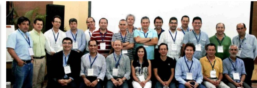
Encuentro nacional capítulo Hombro y Codo – Octubre 2014