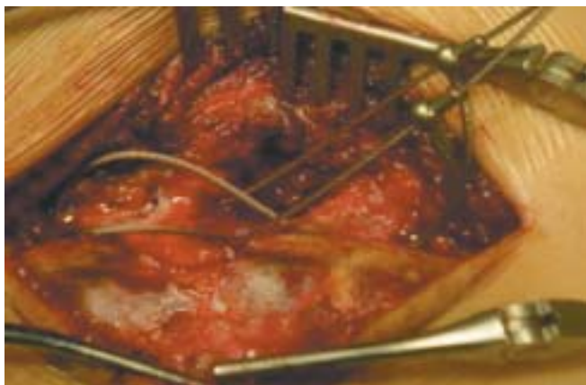
Figura 2. Configuración en ocho de los cables de titanio.

Las hemivértebras fueron 9 (82%) totalmente segmentadas y 2 (18 %) parcialmente segmentadas. De estas 6 (55 %) fueron lumbares, 4 (36. %) torácicas y 1 (9%) toracolumbar. La localización más frecuente fue L2 con 3 casos.